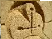
Figura de la imaginería popular religiosa, en honor a la patrona de la localidad, la venerada Virgen de Los Desamparados de Buendía.